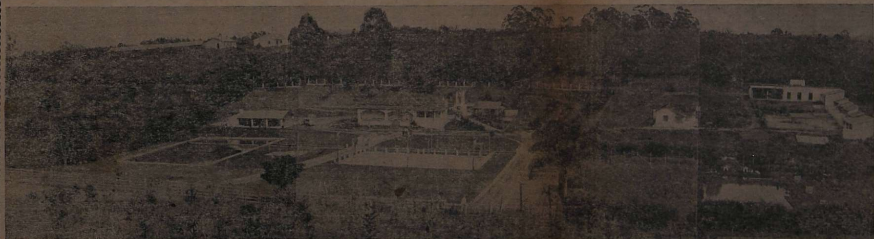
No clichê, vista geral da Sede de Campo do Clube dos Bancários, extraordinário empreendimento social, que deverá constituir um dos locais de maior atração turística durante os festejos do IV Centenário de Guarulhos em 1960.