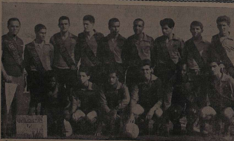
No Cliche vemos a Equipe do União Vila Augusta F. C. Campeão de 1964, numa das melhores campanhas da sua História levando bem alto o nome do bairro que lhe empresta o Nome.

A CARIDADE é uma das maiores virtudes. Não é dando esmolas na rua que se pratica a caridade. É necessário pensar a necessidade do pedinte, e este é o principal ato dos Vicentinos e das Damas de Caridade. Auxiliai-os!