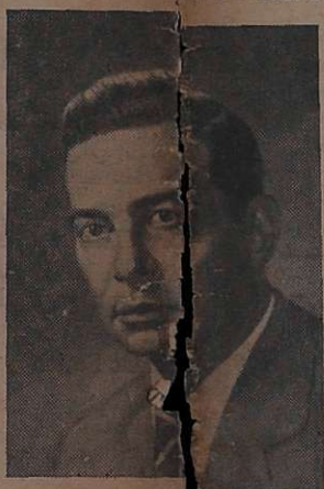
SENADOR AURO MOURA ANDRADE

Disse-lhes que não sou um politico e jamais usei, portanto, de quaisquer meios usuais da politica para as minhas campanhas. Eu as faço sempre à luz da verdade, mesmo quando ela tenha que ser afirmada contra mentiras unânimesmente aceitas. O tempo tem feito com que cada dia me convença de uma triste realidade brasileira. Acreditem os senhores, e o Brasil é muito