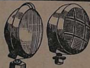
Accessórios: Faróis, lanternas, cetrocas, pistões pneumáticos com chaves manobreadores de portas de ônibus.