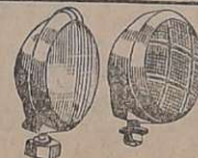
Accessórios: Faróis, lanternas, cunhas, pistões pneumáticos com chaves manobreadoras de portas de ônibus