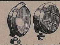
Accessórios — Faróis, lanternas, catracas, pistões pneumáticos com chaves manobreadoras de portas de ônibus