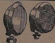
Accessórios: Faróis, lanternas, caixas, pistões pneumáticos com chaves manobradas de porças de ônibus