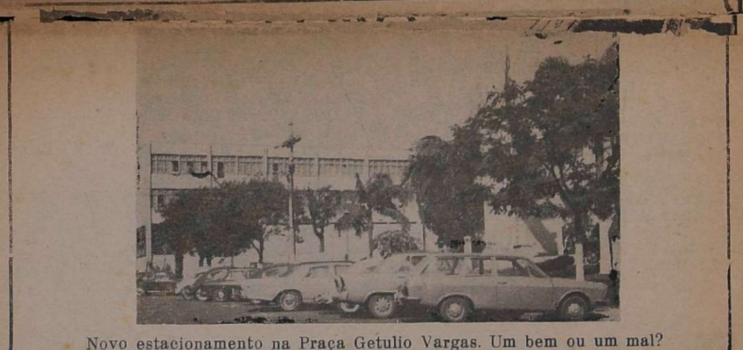
Novo estacionamento na Praça Getúlio Vargas. Um bem ou um mal?