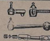
Terminais e Barras de direção de aço forjado, para carros e caminhões de 1929 até 1961