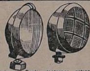
Acessórios - Faróis, lanternas, catracas, pistões pneumáticos com chaves manobreadoras de portas de ônibus