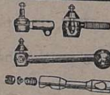
Escavadeiras e Barras de direção de aço forjado, para carros e caminhões de 1929 até 1961