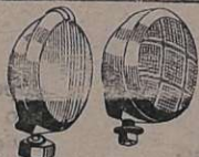
Acessórios - Ferris, lanternas, catracas, pistões pneumáticos com chaves manobreadoras de portas de ônibus