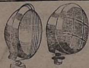
Acessórios: Faróis, lanternas, cisternas, pistões pneumáticos com chaves manométricas de pressão de ônibus