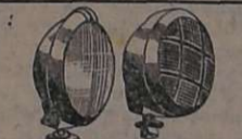
Accesorios: — Fôrda, lanternas, catriças, pistões pneumáticos com chaves manobráveis de portas de ônibus