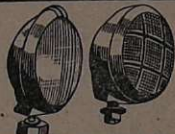
Accessórios — Faróis, lanternas, caixas, pistões pneumáticos com chaves manobreadoras de portas de ônibus.