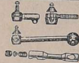
Terminais e Barras de direção de aço torçido, para carros e caminhões de 1929 até 1961