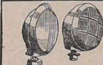
Accessórios — Faróis, lanternas, cântaros, pistões pneumáticos com chaves manobreadores de portas de ônibus.