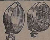
Accessórios — Faróis, lanternas, catracas, pistões pneumática com chaves manobreadoras de portas de ônibus