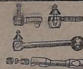
Terminais e Barras de direção de aço forjado, para carros e caminhões de 1920 ate 1961