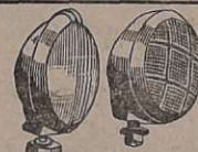
Accessórios — Faróis, lanternas, catracas, pistões pneumáticos com chaves manobradoras de portas de ônibus