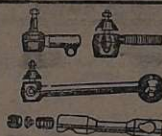
Terminais e Barras de direção de aço torçado, para carros e caminhões de 1929 até 1961