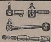
Terminais e Barras de direção de aço forjado, para carros e caminhões de 1020 até 1961