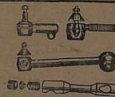
Terminais e Barras de direção de aço forjado, para carros e caminhões de 1929 até 1961