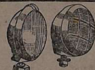
Acessórios — Faróis, lanternas, caixas, pistões pneumáticos com chaves manobreadoras de portas de ônibus.