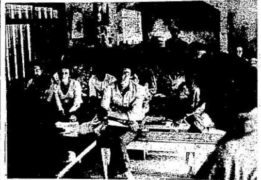
Plenário também discutiu a campanha salarial de Guarulhos e Osasco para 1980

Se este País fosse sério, as autoridades encarregadas de apurar os atentados terroristas, já teriam, pelo menos, uma séria denúncia para investigar: a existência ou não da chamada "Operação Cristal", denunciada à Nação pelo deputado Genival Tourinho (PDT-MG). Segundo o deputado, as bombas que andam explodindo em diversos pontos do País e matando gente, fazem parte dessa "Operação Cristal", cujos responsáveis seriam importantes figuras militares como o general Milton Tavares, comandante do II Exército; o general Antônio Bandeira, comandante do III Exército, e o general Coelho Neto, comandante da 4ª Região Militar, sediada em Belo Horizonte. O deputado revelou que essas informações lhe foram passadas por um militar que já fez parte do esquema de segurança do general Bandeira. Quem vai apurar isso?