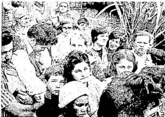
Nas reuniões, os moradores do Jardim Paraíso discutem seus problemas e encaminham as reivindicações

No dia 14 de setembro às 14 hs. na Rua 23 nº 35 haverá outra reunião onde serão discutidos novos passos para o movimento.