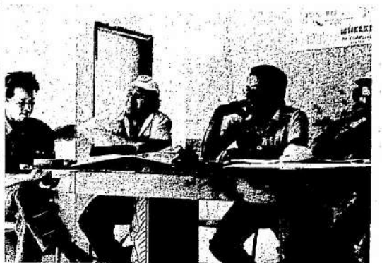
A Comissão Municipal do PT presidiu o debate.