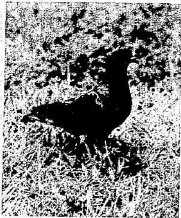
O pombo-correio é capaz de voar, em média, a 70 quilômetros por hora.

O Campeonato Paulista é disputado pelas equipes formadas pelos criadores sócios dos clubes e sociedades de columbofilia de S. Paulo. As provas são disputadas da seguinte maneira: todos os criadores enviam seus pombos, no máximo 50, para o local de partida e, no dia marcado, os pombos são soltos e vencem aqueles que primeiro chegam em casa. A cidade de Guarulhos é representada no