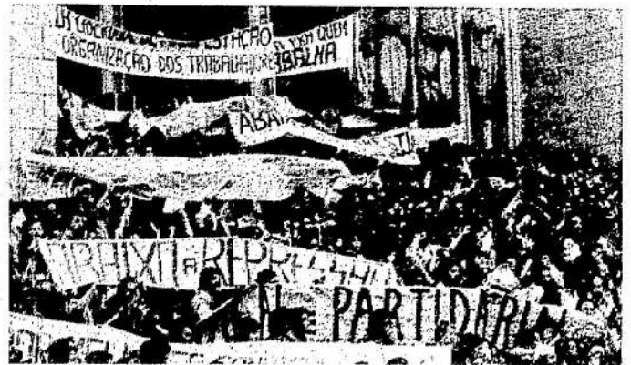
Na Sé, 15 mil pessoas protestam contra a carestia.

Os trabalhadores ganham cada vez menos, enquanto o preço das mercadorias sobe — 75 por cento dos trabalhadores brasileiros ganham de dois salários mínimos para baixo e 40 por cento da população é subnutrida — Em consequência, os ricos estão cada vez mais ricos — O governo é o principal culpado. Pág. 3