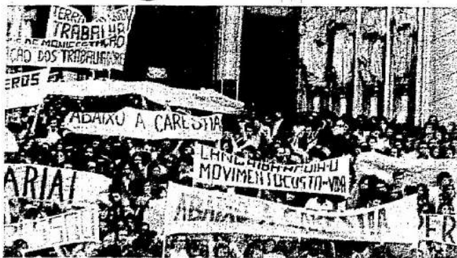
Milhares de manifestantes não conseguiram entrar na catedral da Sé e se aglomeraram na escadaria da igreja.

Ocorre que o Brasil é um dos países onde há maior concentração de renda do mundo. Só para citar um exemplo, enquanto os trabalhadores estão cada vez mais pobres, a Volkswagen, em 1976, teve um lucro líquido de 450 milhões de cruzeiros, o que equivale à renda de 100 jogos