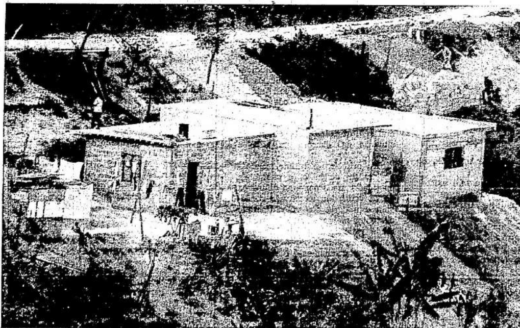
Famílias são pressionadas para regularizar as plantas.